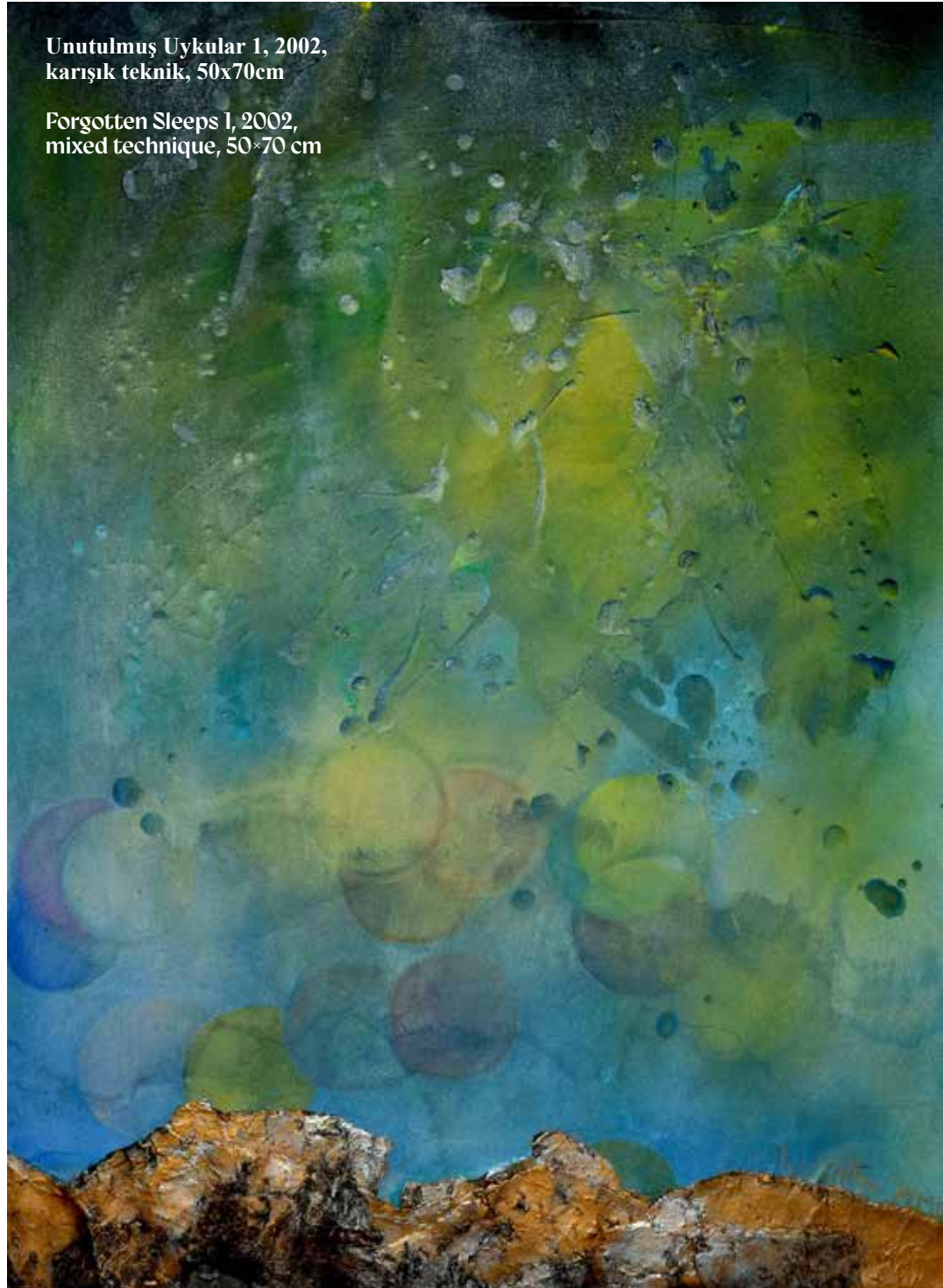
Forgotten Sleeps 1, 2002, mixed technique, 50x70 cm