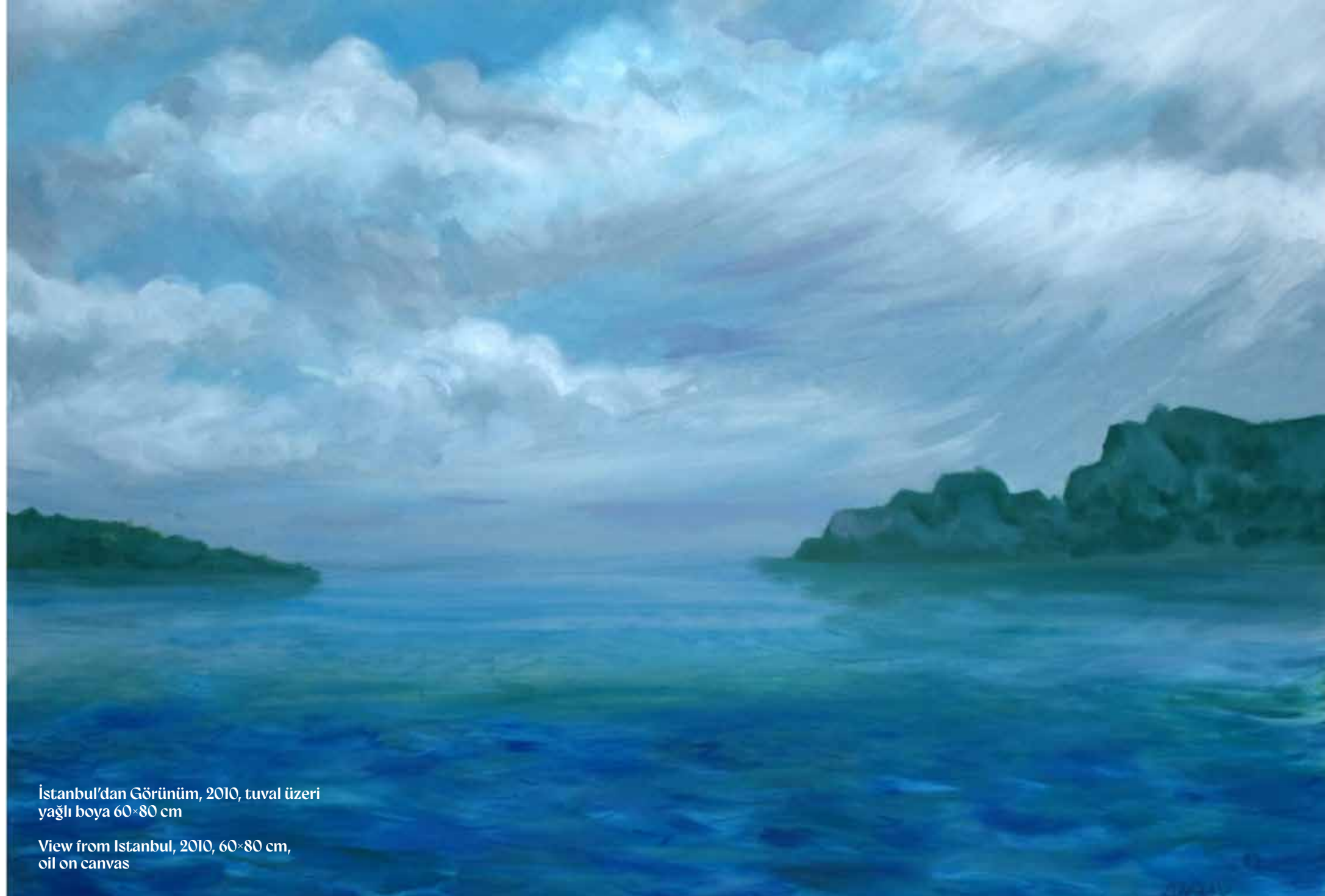
İstanbul'dan Görünüm, 2010, tuval üzeri yağlı boya 60x80 cm