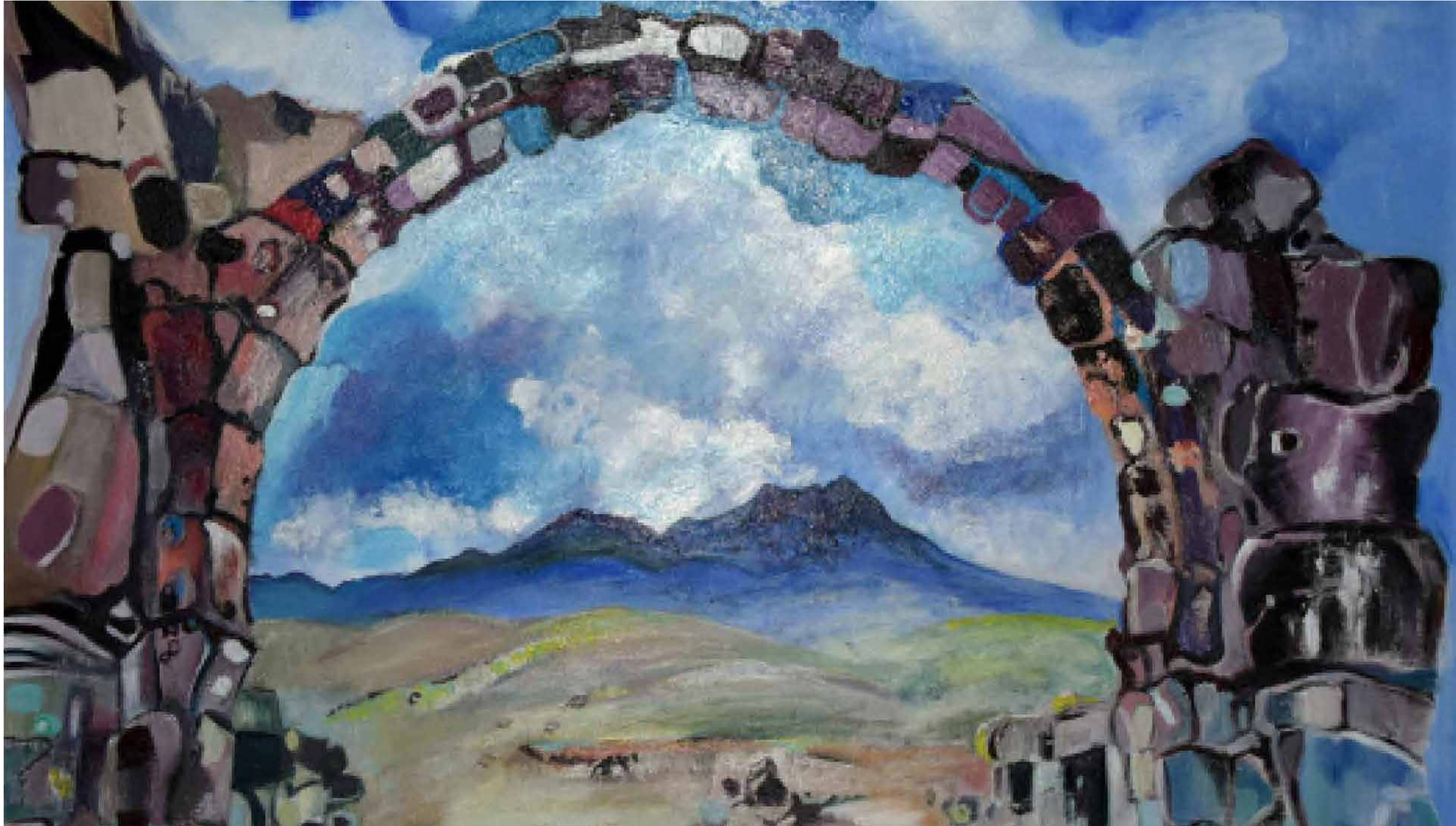
Nora Antik Kent, 2015, tuval üzeri akrilik, 60×80cm