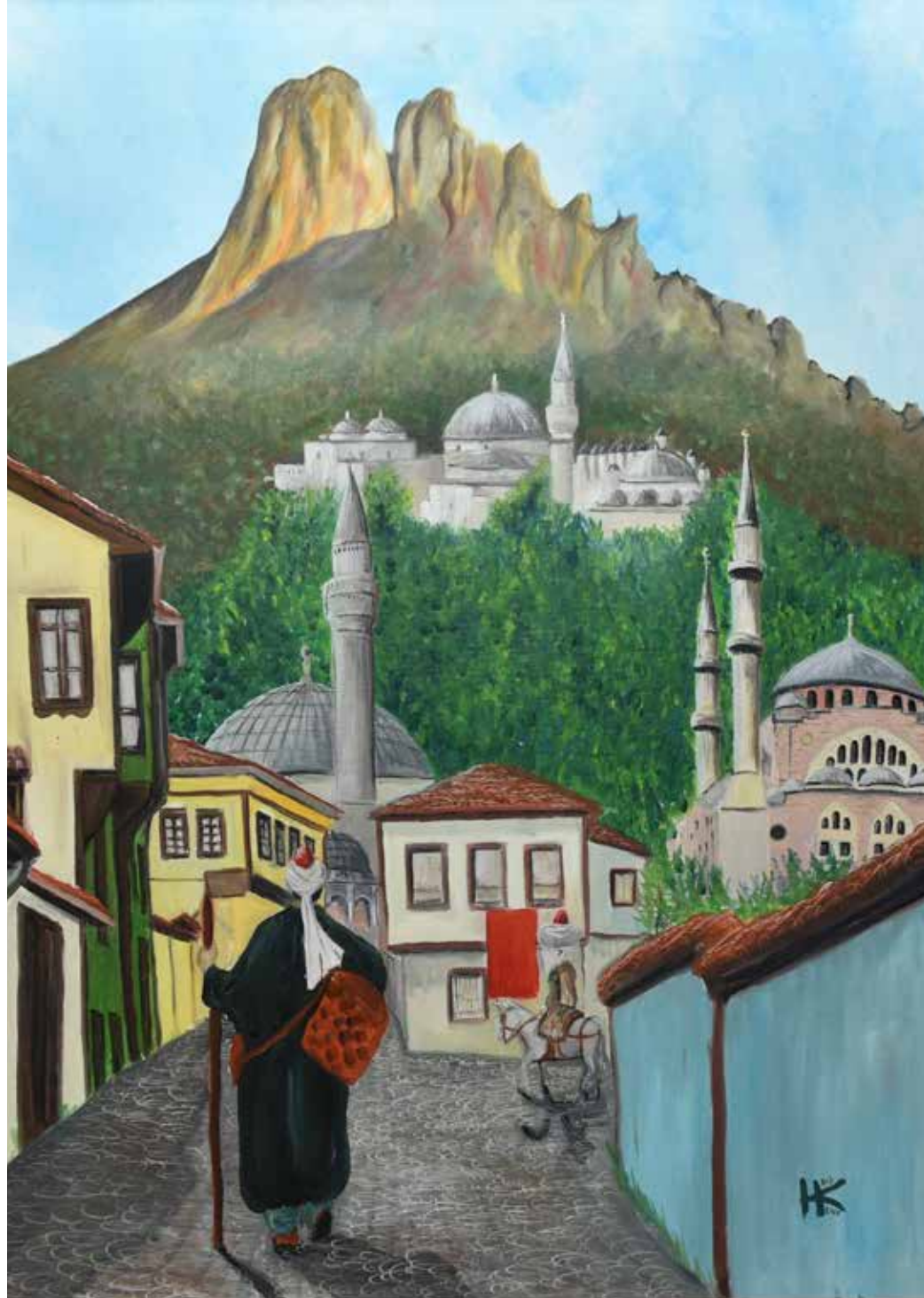
Şehri Eski, 2013, tuval üzeri yağlı boya, 60x80cm