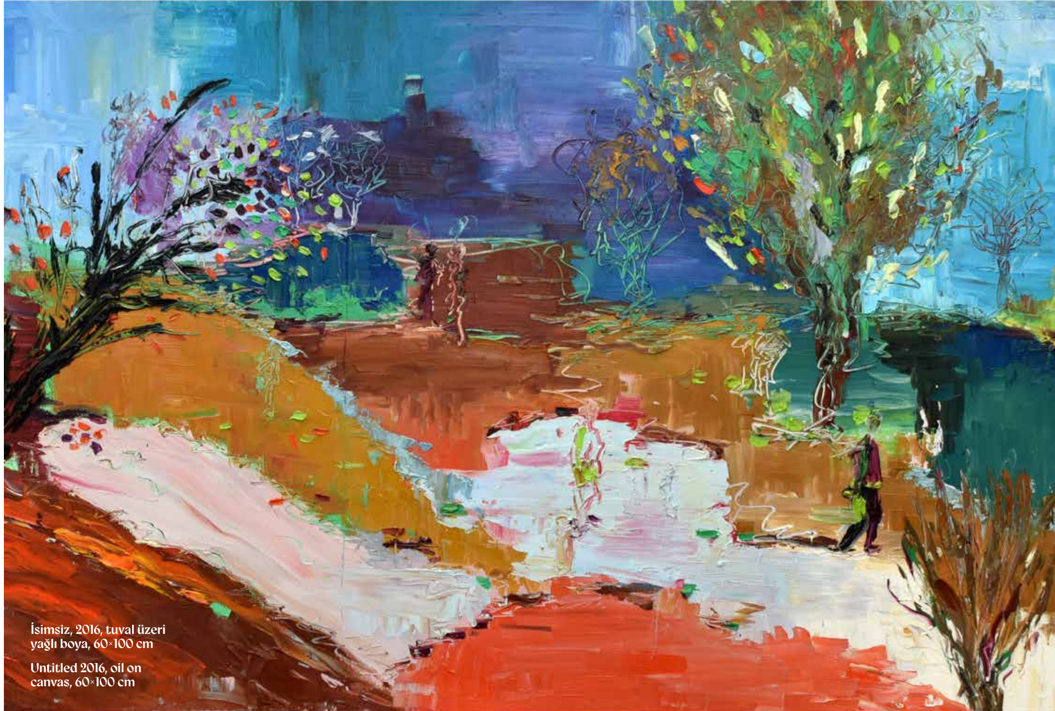
İsimsiz, 2016, tuval üzeri yağlı boya, 60×100 cm