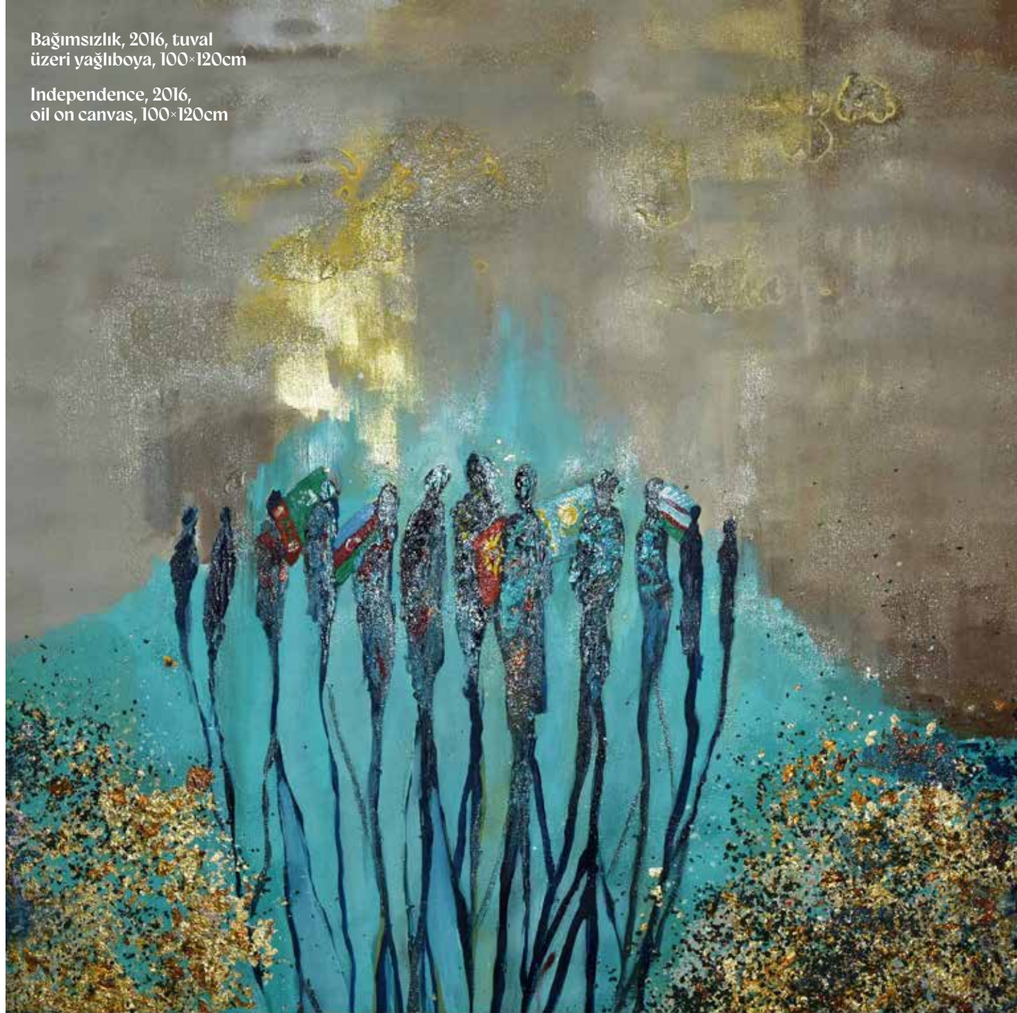
Independence, 2016, oil on canvas, 100x120cm