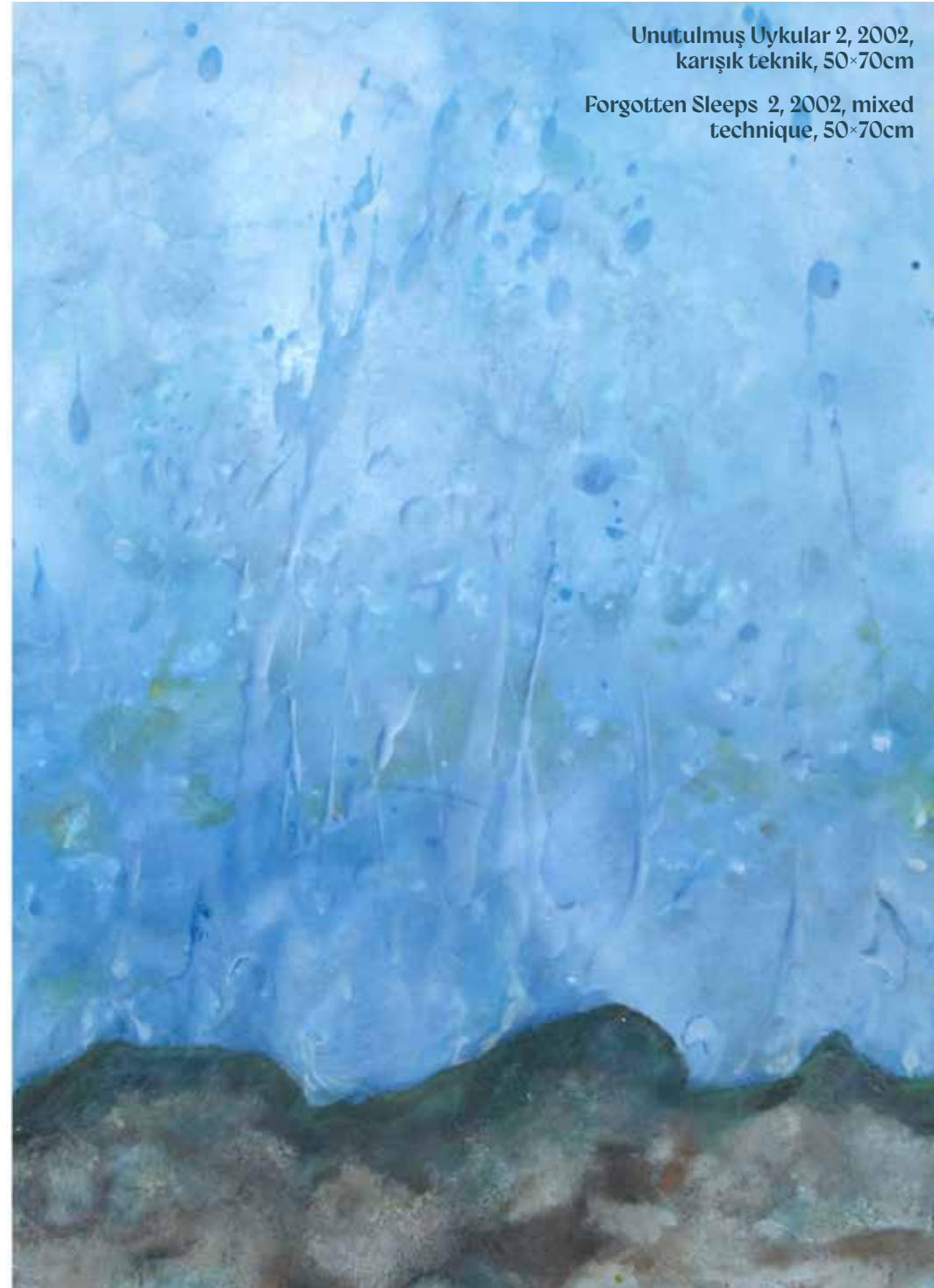
Forgotten Sleeps 2, 2002, mixed technique, 50x70cm