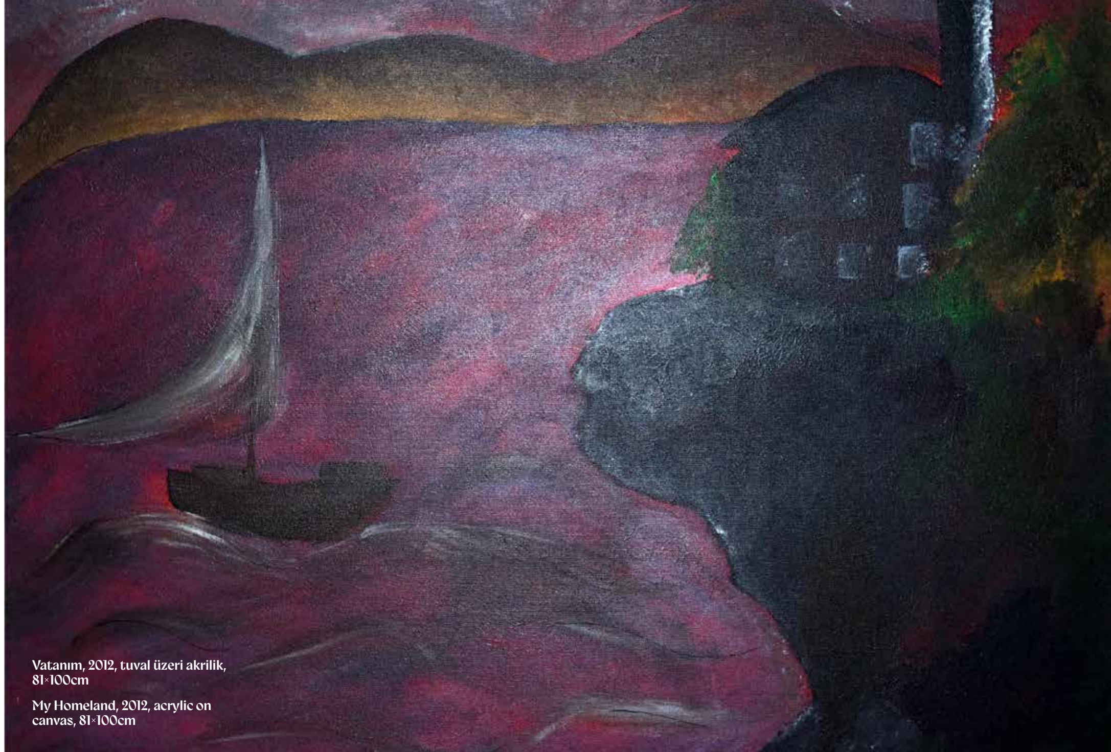
Vatanım, 2012, tuval üzeri akrilik, 81x100cm