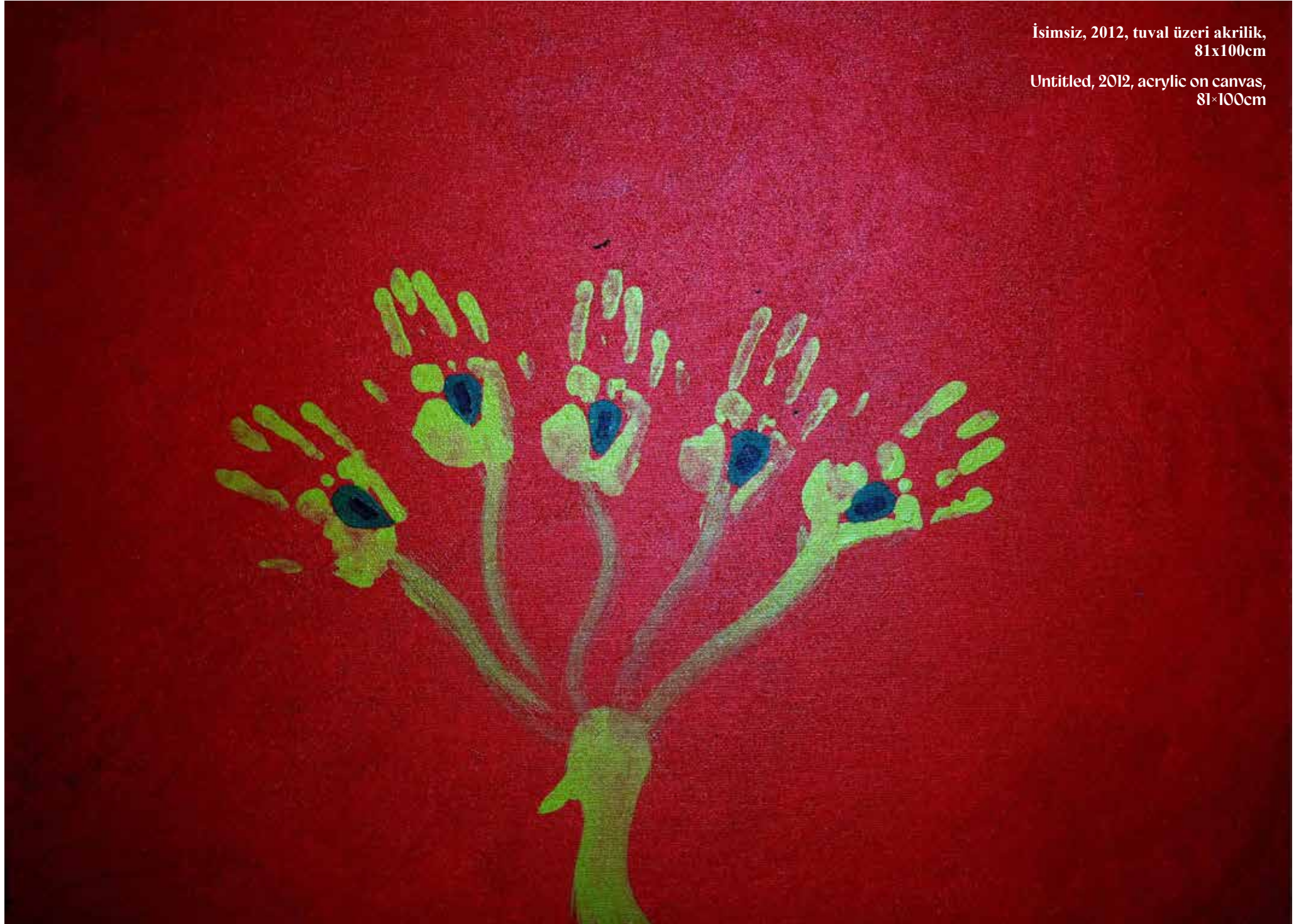
Untitled, 2012, acrylic on canvas, 81x100cm