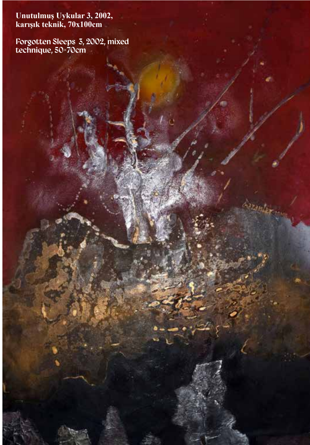
Forgotten Sleeps 3, 2002, mixed technique, 50x70cm