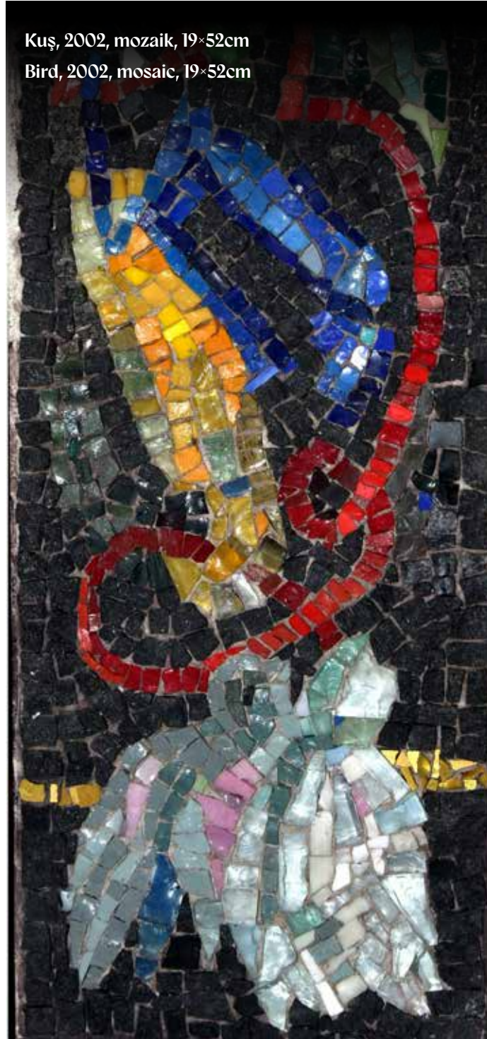
Kuş, 2002, mozaik, 19x52cm Bird, 2002, mosaic, 19x52cm