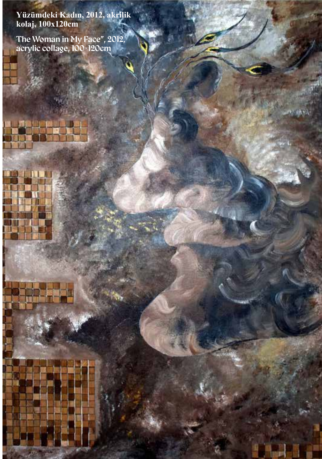
"The Woman in My Face", 2012, acrylic collage, 100x120cm