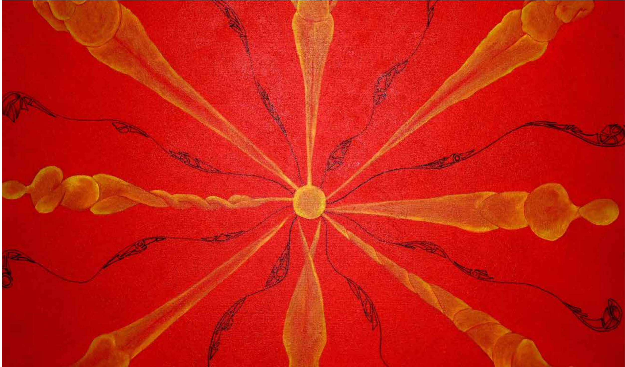
Kadının Bin Bir Hali, 2012, tuval üzeri akrilik, 81×100cm