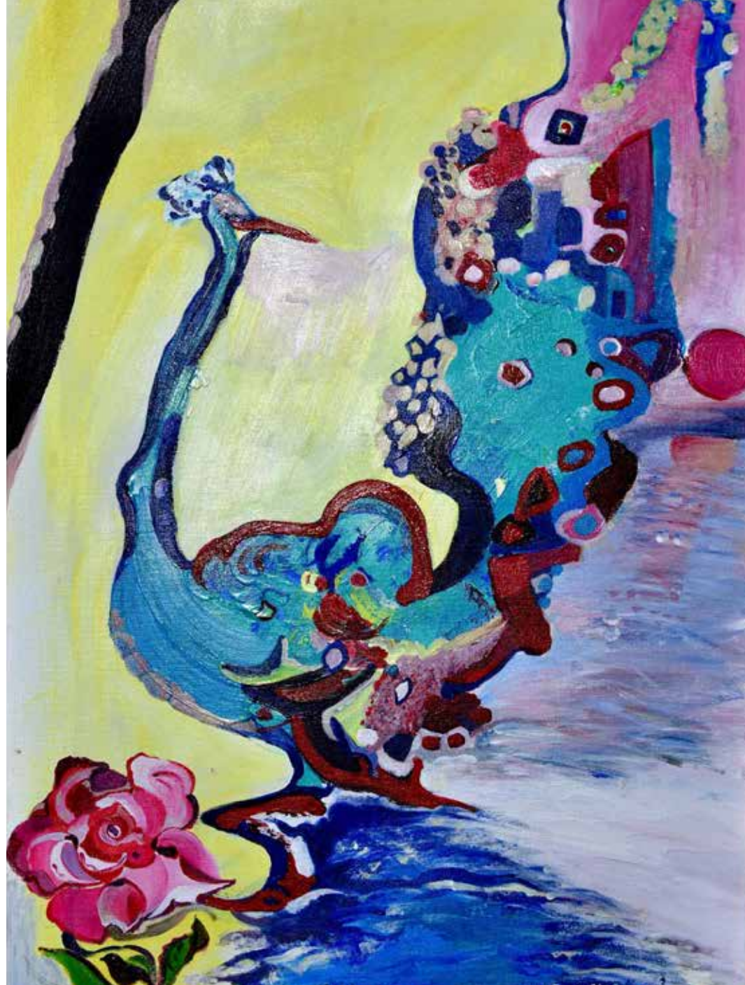
Tuz Gölü, 2015, tuval üzeri akrilik, 50×70cm